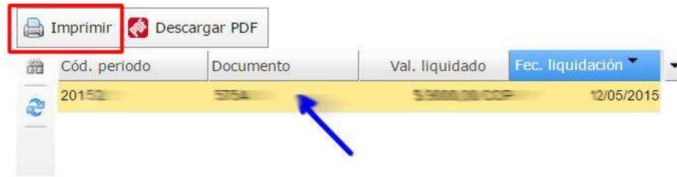
Imagen 3. Imprimir Recibos de Pago